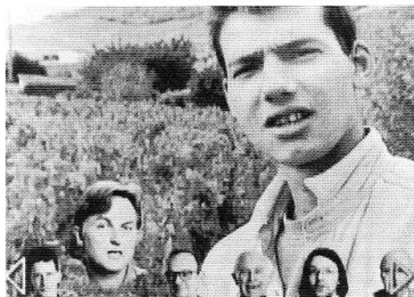
Een soort 'touch-screen' scherm, waaruit keuzes worden gemaakt

Klinkt ingewikkeld? Je kunt van Part Time God zeggen wat je wilt, origineel is het in elk geval wel. Via de zwerftocht langs schijnbaar willekeurige beelden, scènes en teksten van pratende hoofdjes komt de inhoud van de film tot stand. Vragen worden opgeworpen omtrent de menselijke vrije wil, verantwoordelijkheid, lotsbestemming en geluk. Een serie levensvragen passeert de revue zonder dat wij een pasklaar antwoord krijgen. Een en ander wordt uitgewerkt in kleine portretten, gebeurtenissen of verhalen; de ene keer aangrijpend, de andere keer leerzaam of grappig. Hoewel de hoeveelheid van de vragen die gesteld worden, en de wil-