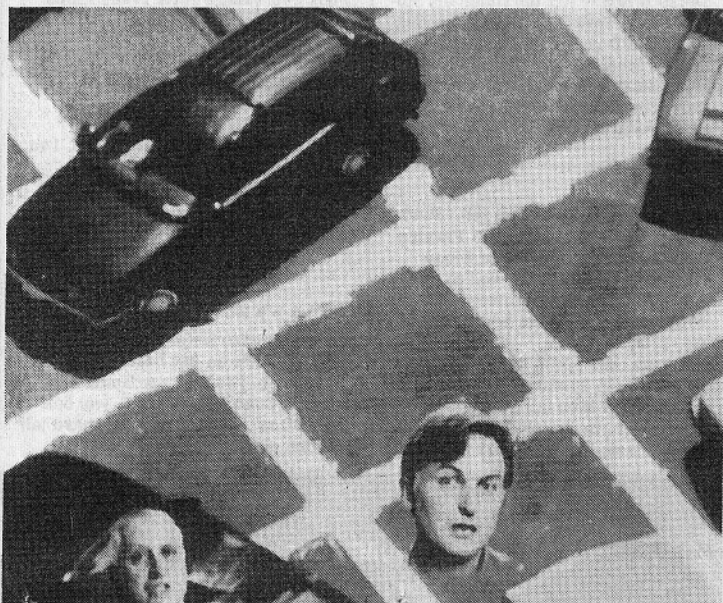
Scène uit 'Parttime God' van Paul Cohen