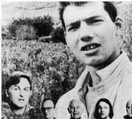
Scène uit de documentaire Part Time God van Paul Cohen

De Newyorkse Jersey lijdt aan borstkanker en moet een operatie ondergaan. We volgen haar als ze in haar atelier afscheid neemt van haar aangetaste borst, waarvan ze in gips een afdruk maakt. Wat het extra dramatisch maakt is haar gevoel dat ze een van de mooiste torso's ter wereld heeft. De ingreep wordt — en daarmee zijn we bij de gruwelijke beelden — onverfrozen getoond. Cohen vermoedt dat vijftig