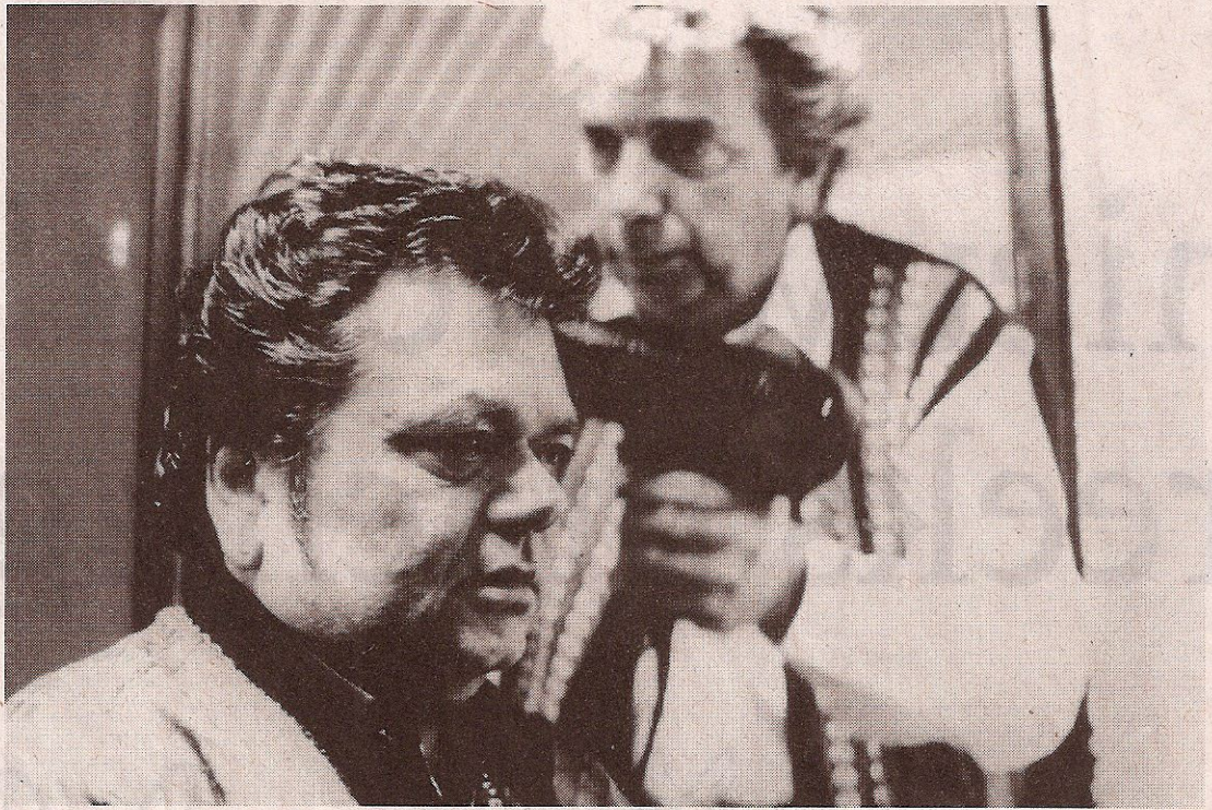
De documentaire Zij gelooft in mij over André Hazes trok veel kijkers.