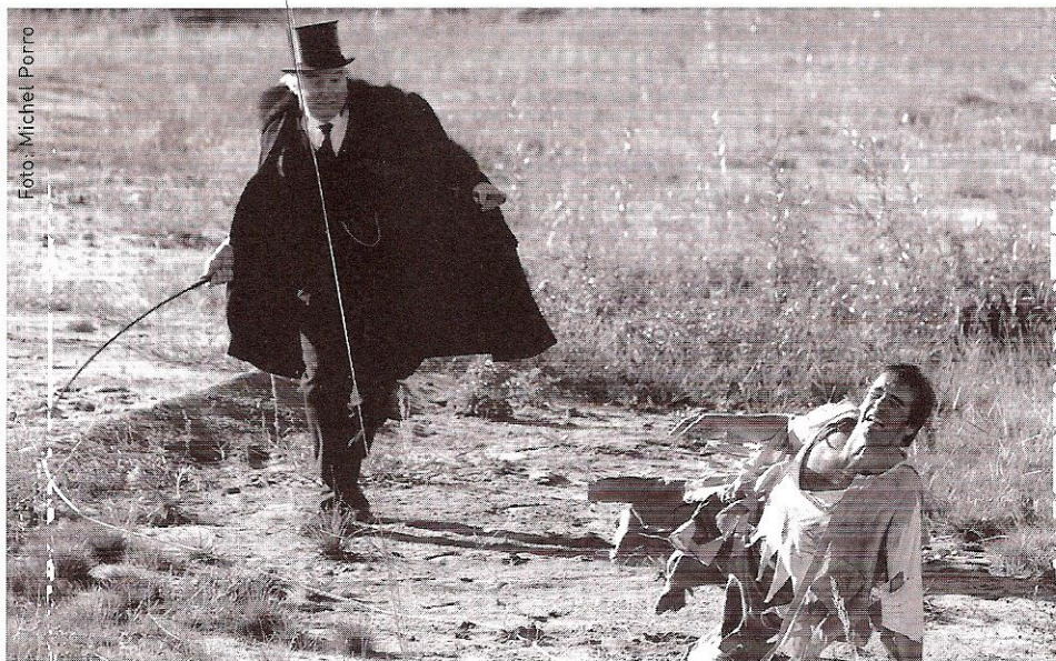
Uit: Strijd der Votharding

In naam van het McKinsey-rapport vindt op dit moment het meest stupide kennis- en kapitaalvernietigende bezuinigingsbeleid in de geschiedenis van de Publieke Omroep plaats. Heren in pakken van McKinsey hebben gesproken met andere heren in pakken: de omroepbazen. Niet met een redacteur, of een maker, of een filmer. Het overgrote deel van omroepmedewerkers in vaste dienst bestaat uit buromedewerkers, produktiemensen, een paar redacteuren, administratief personeel en, uiteraard, managers. Als we de nieuwsprogramma's en -rubrieken buiten beschouwing laten, worden bijna alle kwaliteitsprogramma's bij de Publieke Omroep vervaardigd door zelfstandigen, hetzij in opdracht van de omroep zelf, hetzij via onafhankelijke produktiehuizen. Regisseurs, producers, schrijvers, cameramensen, geluidsmensen, editors, designers, lichtontwerpers, grips, decorontwerpers, visagisten etc., vrijwel allemaal zijn ze zelfstandig.