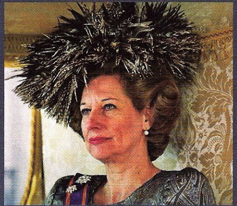
In Majesteit heeft koningin Beatrix geen zin